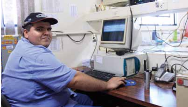
Atenção constante ao tráfego dentro e fora da Usina.

O sistema evita filas de caminhões para o descarregamento no pátio – o descarregamento é feito exclusivamente por dois cavalos mecânicos – e otimiza os caminhões nas frentes de colheita, pois é possível alocá-los durante 24 horas, respeitando as metas diárias das frentes e a característica de cada veículo.