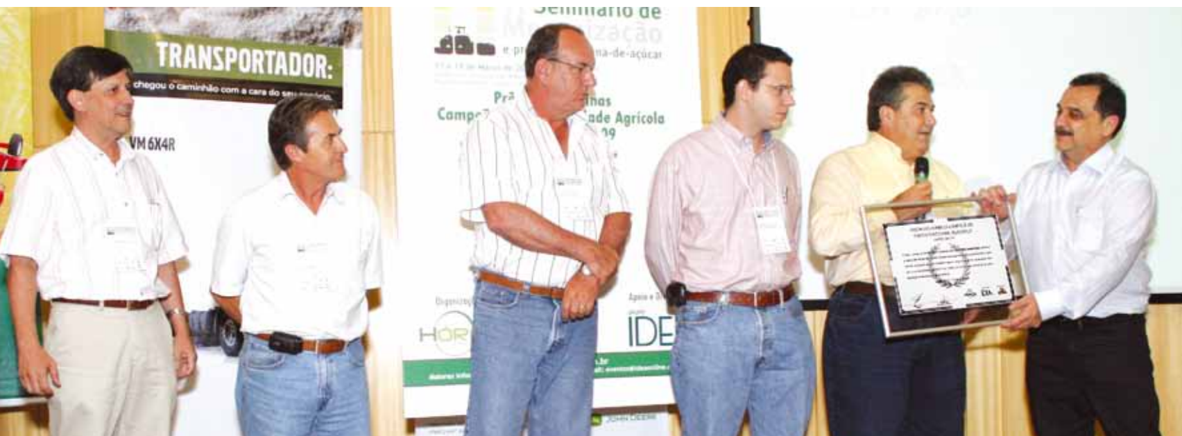
Prêmio "é fruto de muito comprometimento de todos os colaboradores".