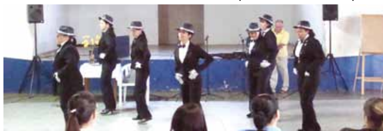
Grupo de dança formado por mães de alunos de Nova Europa